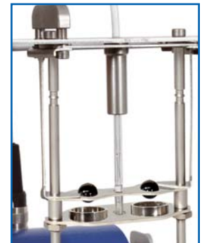
Mechanisches Petrotest® Kugelaufsetzverfahren (das praktische Petrotest®-Verfahren)