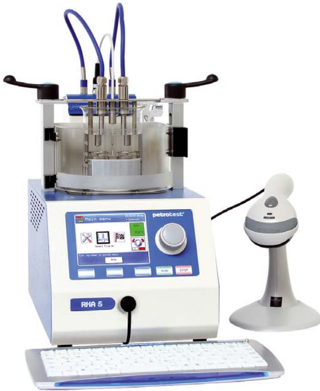
RKA & 10-0851 & 25-0910 & 25-0920