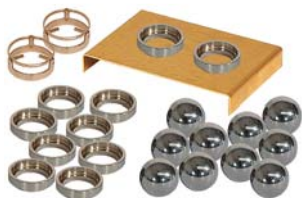
Ring & Kugel Zubehör