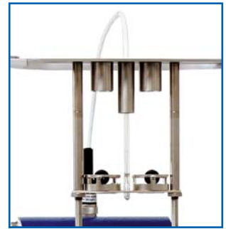
Manuelles Standard-Kugelaufsetzverfahren (die normgerechte Lösung mit Zentrierungen)