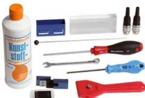
Service Kit 10-0868

10-0868 Service Kit RKA 5 Bestehend aus je 1: Referenzstecker 20°C & 180°C, Scanner- & Kugellehre, Blendschutz, USB-Memory Stick, SD-Karte, Schaber, Kunststoffreiniger und Werkzeugset (Ring-Maulschlüssel, Kreuzschlitz & Sechskant-Kugelkopf Schraubendreher)