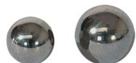
Belastungskugeln (nur für manuelle Geräte) (10-0055 & 10-0077)