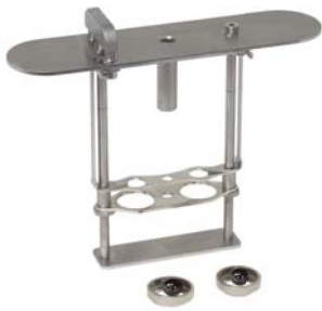
Haltegestell mit: mechanischer Petrotest® Kugel- zentrier- & Aufsetzeinrichtung (10-0840 und Zubehör)