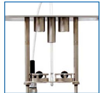
Standard Kugelzentrierung (10-0841 & 2x 10-0052) (normgerechte Lösung mit Zentrierungen, im Austausch für 10-0840 bestellbar)

Der RKA 5 basiert auf modernster Mikroprozessortechnik, kombiniert mit einem Drehgeber-Eingabesystem (Jog-Wheel) . Das Gerät unterstützt Programmabläufe für alle wichtigen Prüfstandards und Badflüssigkeiten sowie für benutzerdefinierte Testbedingungen.