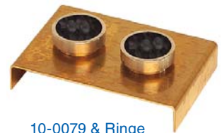
10-0079 & Ringe

10-0864 Prüfstellweiterung RKA 5 “Wilhelmi - automatische Erfassung” (ähnlich EN 1871 / DIN 1996-15) Benötigt Prüfstellset 10-0860!