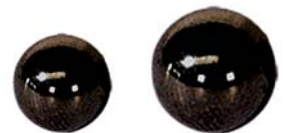
Belastungskugeln (nur für RKA5-Geräte) (10-0805 & 10-0877)