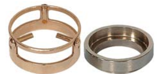
10-0052 & 10-0049