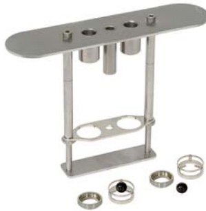
Haltegestell einsetzbar: - normgerecht mit Zentrierringen (10-0841, 2x 10-0052) - in Kombination mit elektromagnetischen Kugelhaltern & Ringen (10-0851)