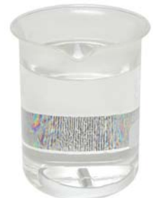
10-0856 (& Magnetrühring)

10-0805 Belastungskugeln , Stahl geschwärtzt, (Ø 9,5 mm, 3,5 g), 10 Stück