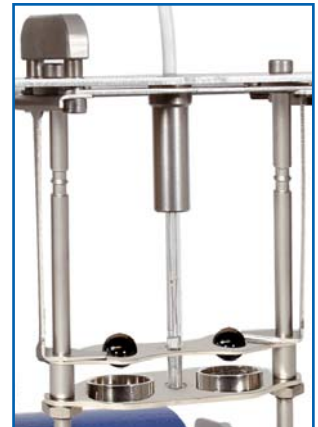
Petrotest® Kugelzentrier- & Aufsetzeinrichtung (10-0840) (komfortables Petrotest®-Verfahren, im Lieferumfang enthalten )